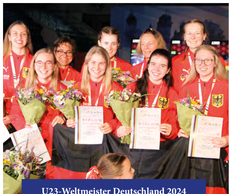
U23-Weltmeister Deutschland 2024