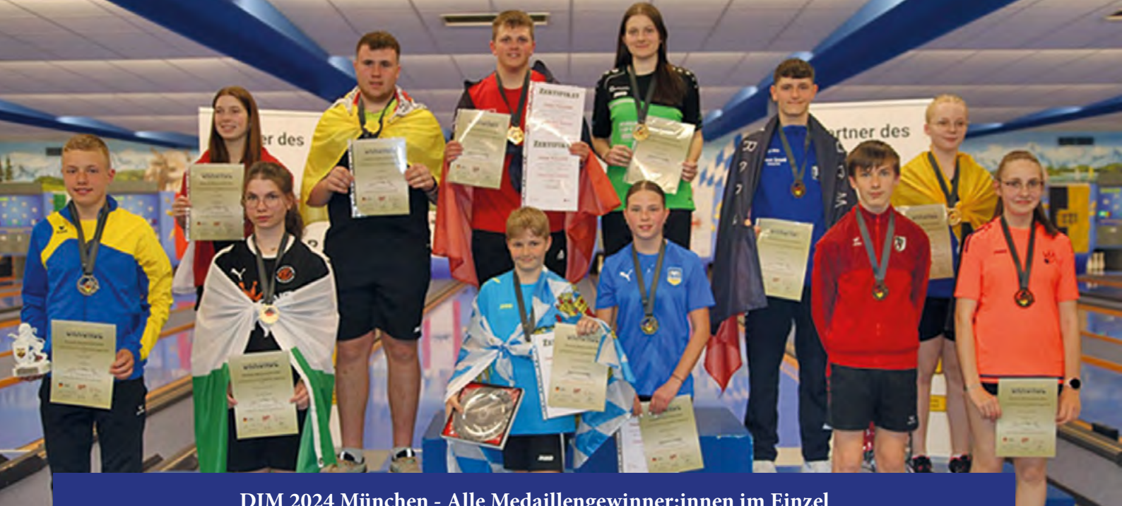
DJM 2024 München - Alle Medaillengewinner:innen im Einzel