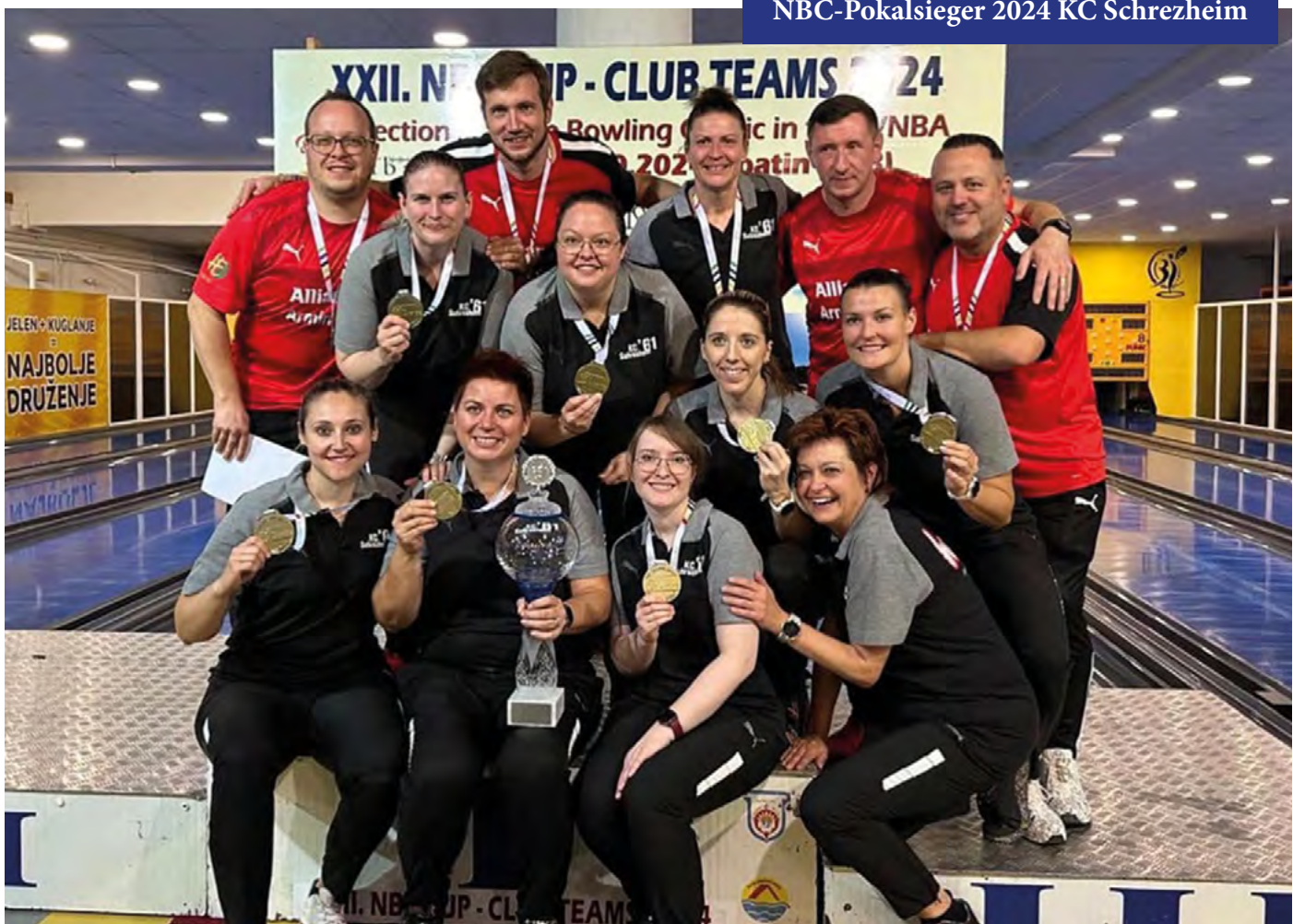
NBC-Pokalsieger 2024 KC Schrezheim