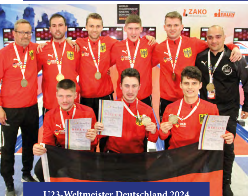
U23-Weltmeister Deutschland 2024