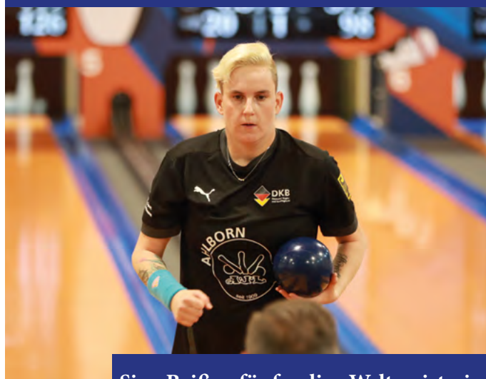
Sina Beißer, fünfmalige Weltmeisterin

* umfasst den Zeitraum seit der Gründung des DKBC