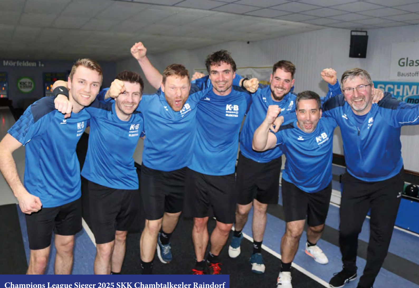
Champions League Sieger 2025 SKK Chamdtalkegler Raindorf