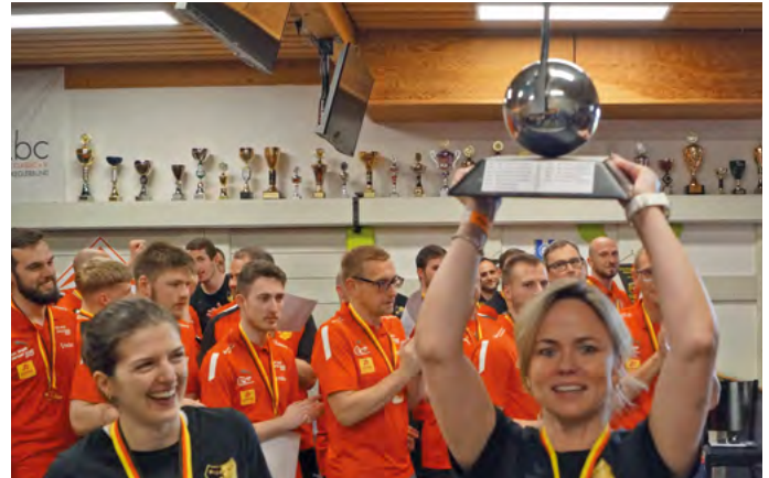
DKBC-Pokal Final Four 2024

Unser 25. Geburtstag am 9. September 2025 ist sicherlich ein wichtiger Meilenstein, aber zugleich ein Ansporn, das Classic-Kegeln weiterhin attraktiv zu gestalten – von der nationalen Basis bis zur internationalen Spitze.