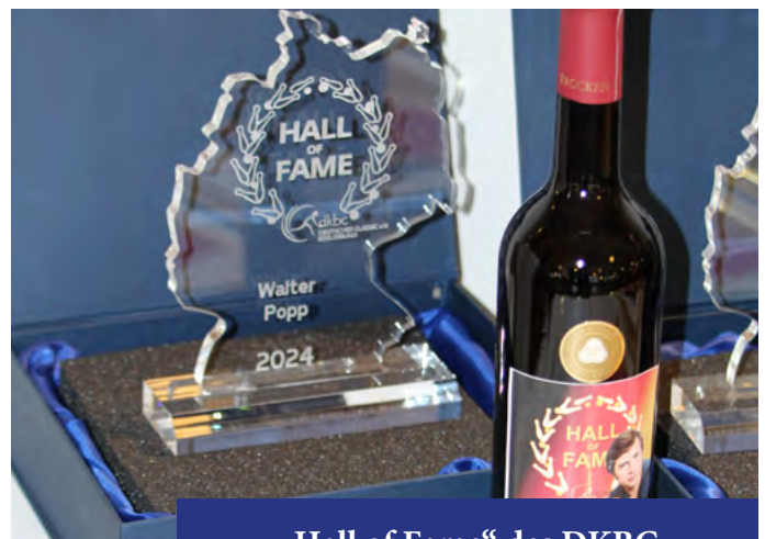
„Hall of Fame“ des DKBC