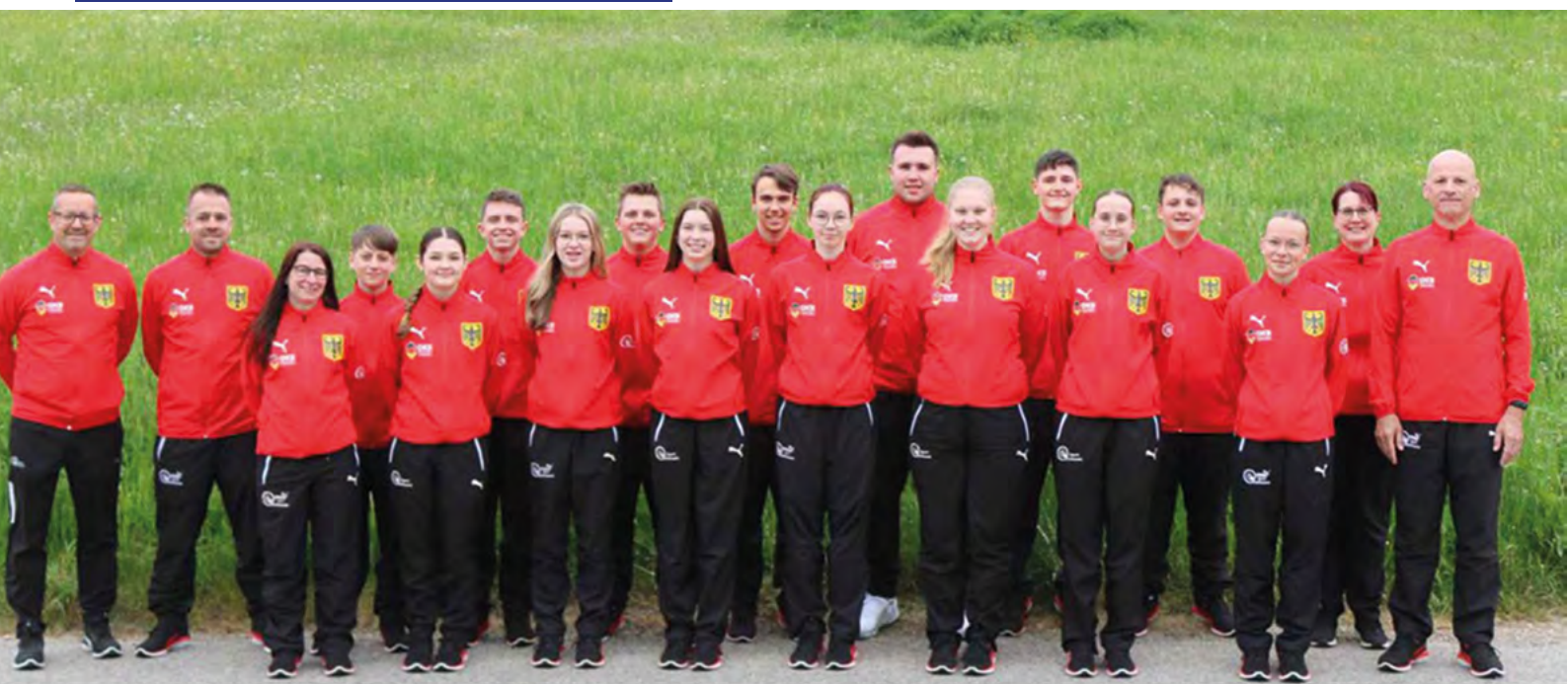
EM-Team U18 und U14 Deutschland 2024