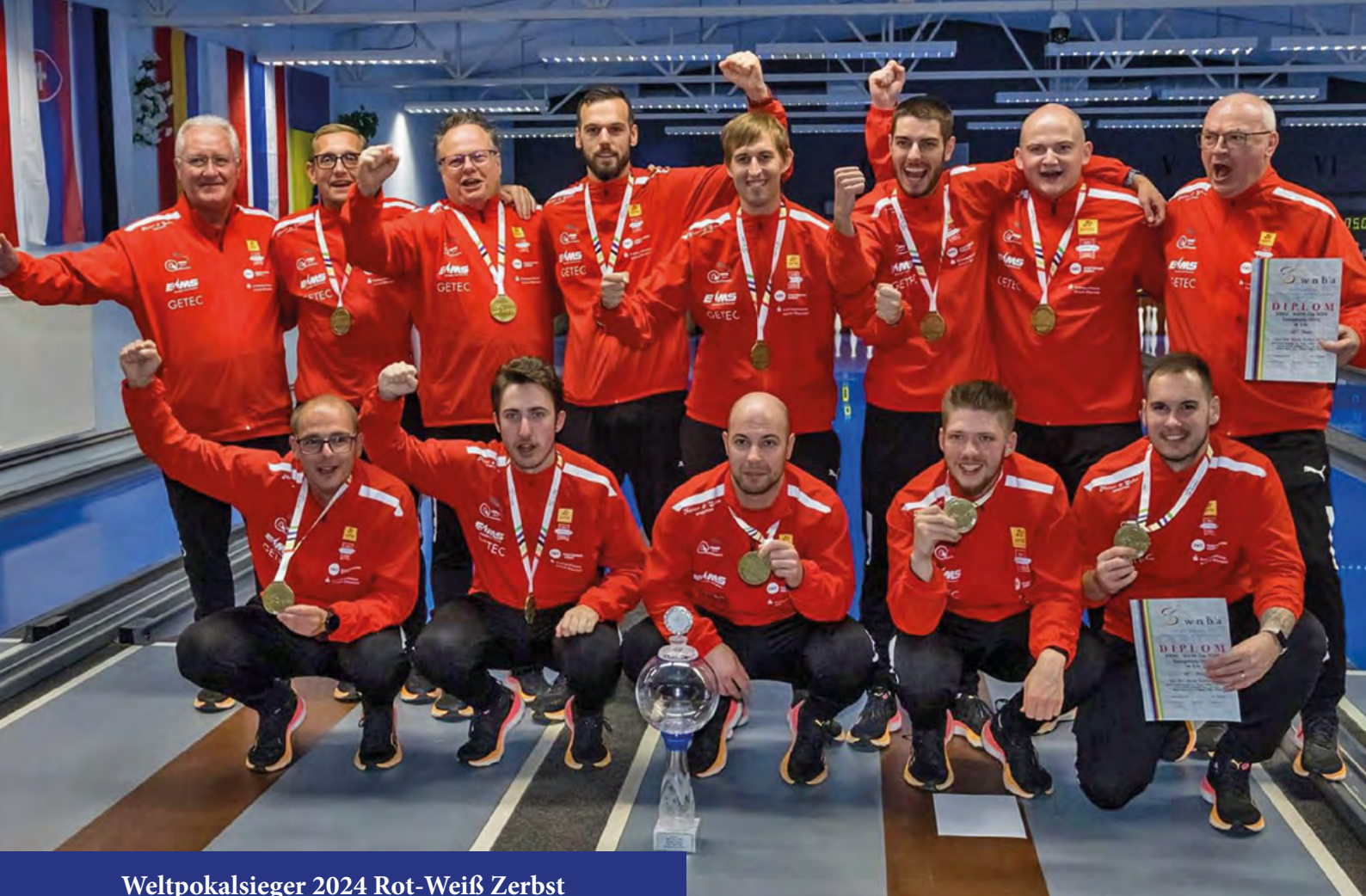
Welpokalsieger 2024 Rot-Weiß Zerst